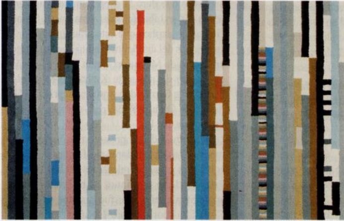
Alfombra Lepark, diseñada por Enblanc para Gandía Blasco.