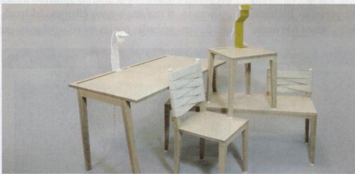
Maqueta de la colección de muebles Monarchy, de Hausdesign.