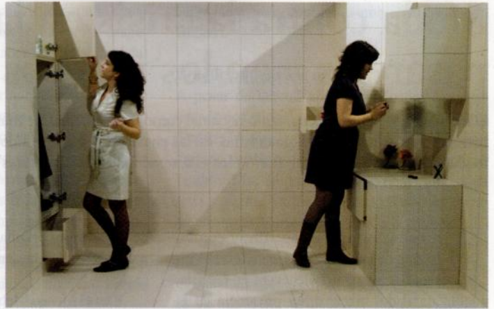
Combinación de muebles integrados Desapercibido, del estudio de Diseño Fluye.