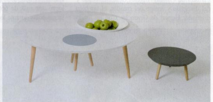
Mesa auxiliar y taburete de estudio 3Patas.